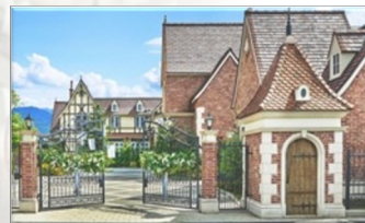
ネオスマラベル（山梨）