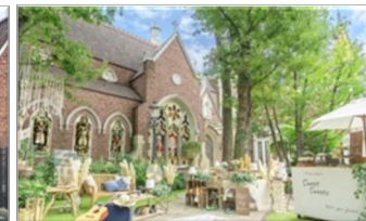
キャメロットヒルズ（埼玉）