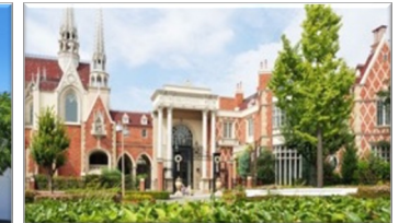
グラストニア（名古屋）